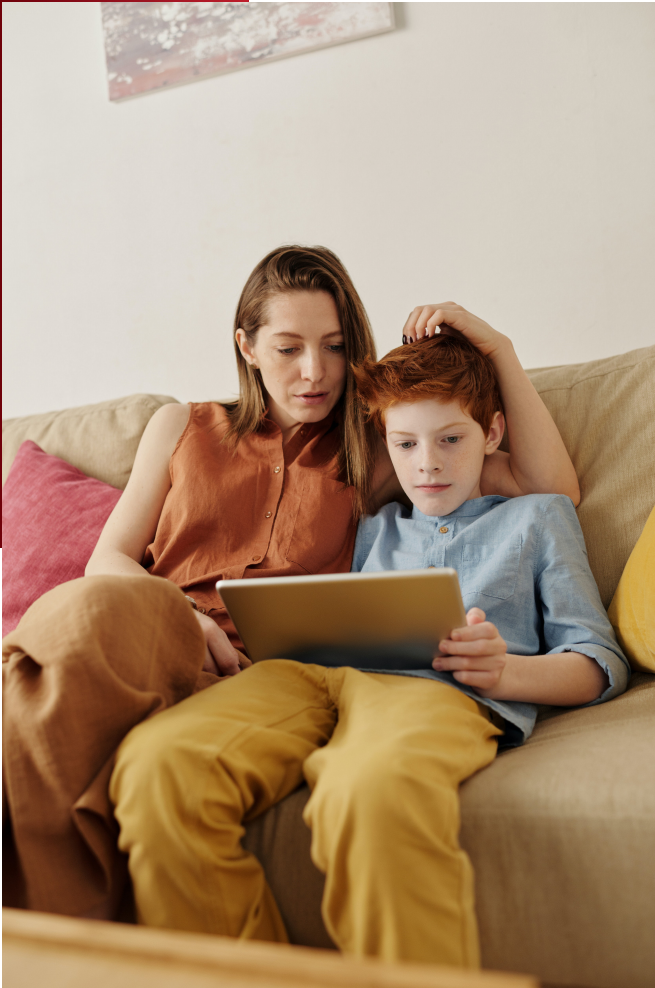
Fotografía tomada por Julia M Cameron

Cuando cambio mi propia guarida de la casa a mis oficinas, voy contemplando las calles al principio vacías, fluidas, y miraba las fachadas de las casas, casonas y departamentos del camino, y me preguntaba cuántas personas la pasarían mejor en esta realidad que se nos impuso rápido en 2020, cuántas estarían peor que antes por el solo hecho de pedir el cuidado de mantenerse en casa. Un dato por demás duro de leer es el aumento de los índices de violencia en casa entre las familias, violencia no solo al género femenino sino a los hijos, a los hombres de familia, al núcleo familiar en sí mismo. Y es que ¿quién pensaría que llegaría el tiempo en el que encerrados en la casa de tus sueños, con el amor de tu vida, con los críos que amorosos crearon, ahora podría volverse sofocante una convivencia acentuada por estar todos en casa?.